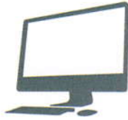
デスクトップパソコン