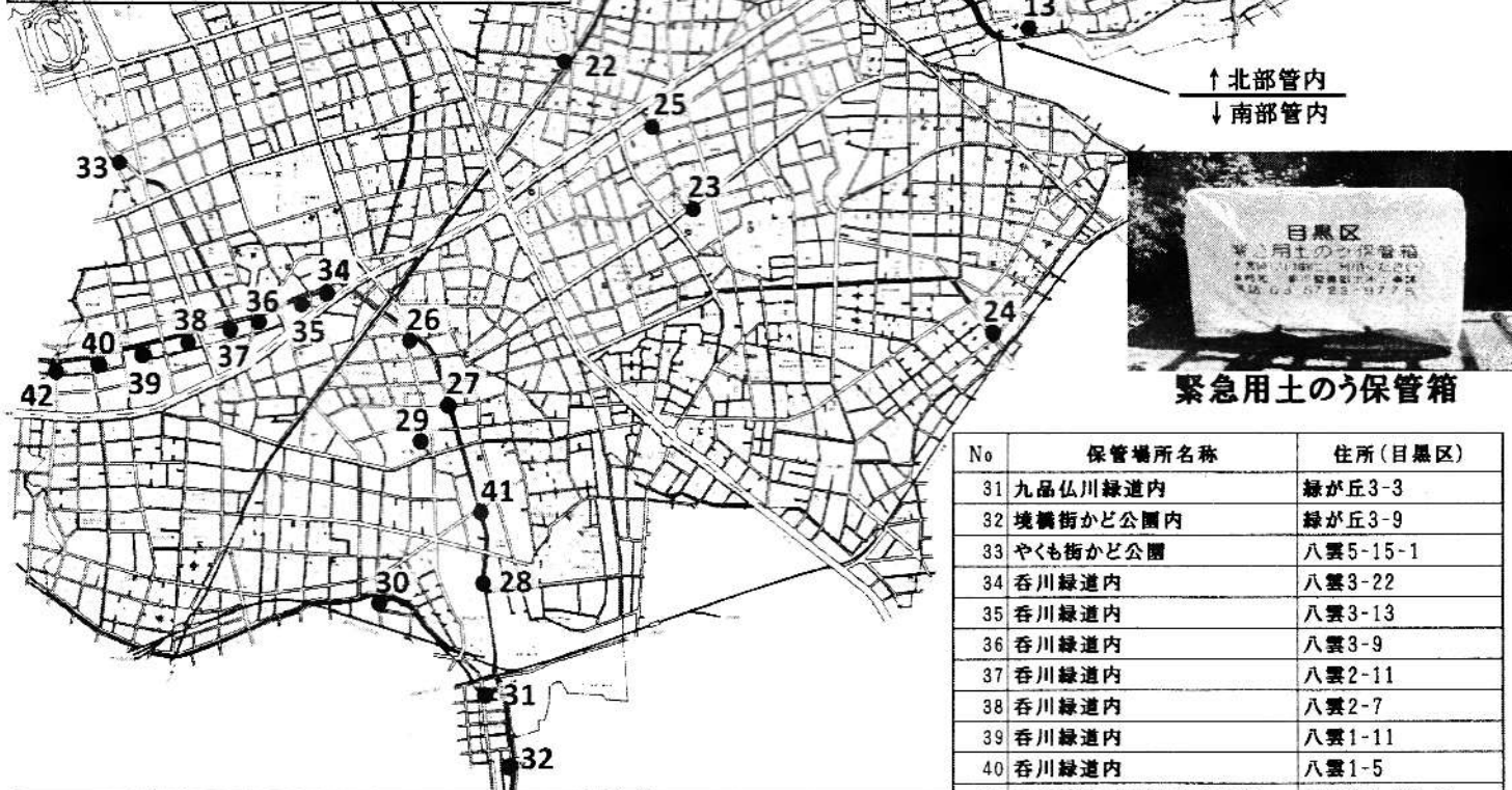
緊急用土のう保管箱