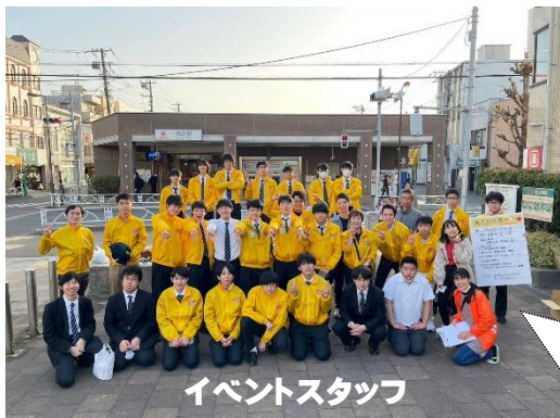
イベントスタッフ

次回のイベントは、2023年6月9日に天皇皇后両陛下ご成婚30周年になりますので、時期を合わせて「洗足プリンセスフェスタ」を開催予定です。