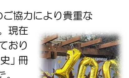
自由ヶ丘学園高校吹奏楽部